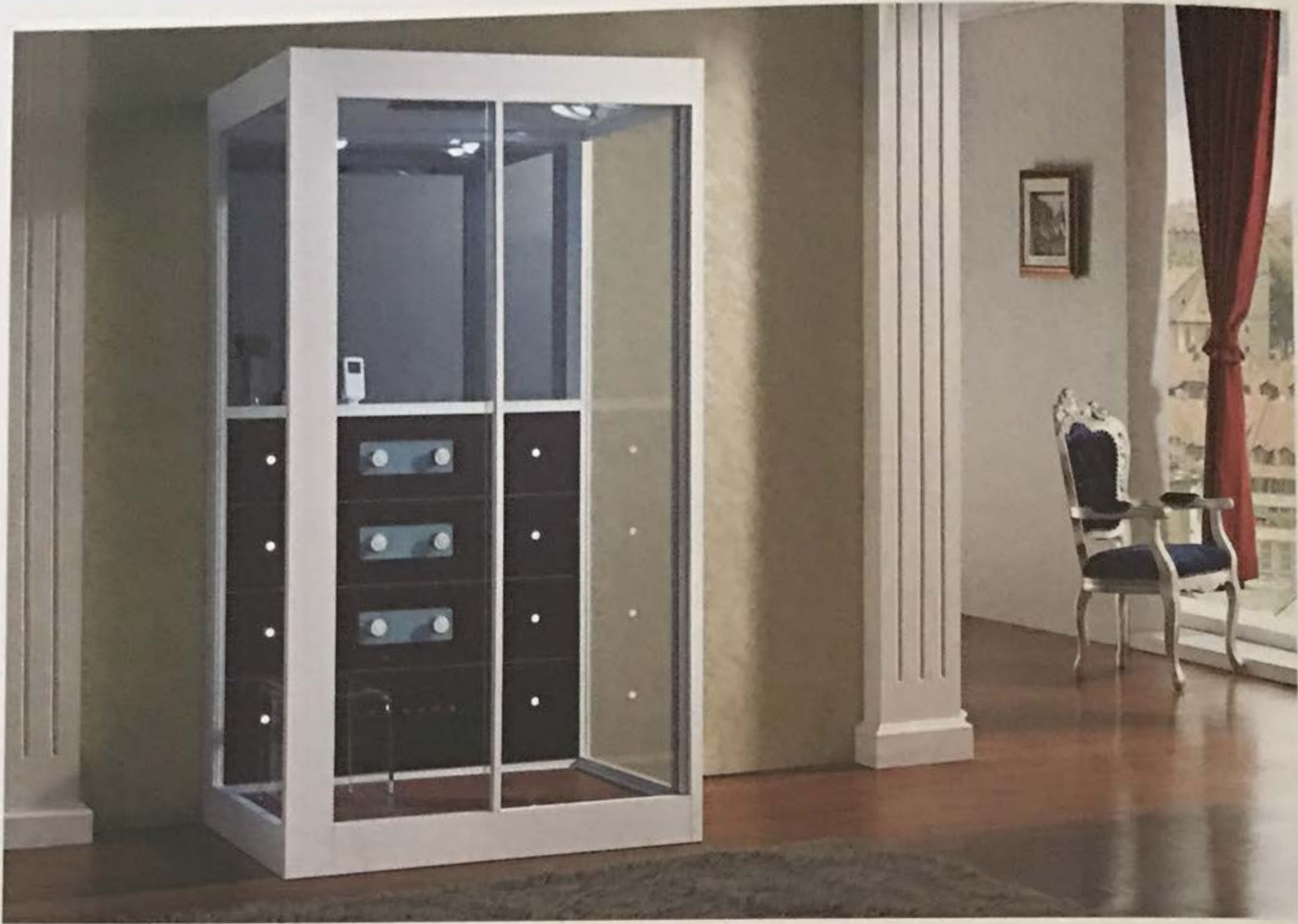
Dank umweltfreundlicher Ozonreinigung haben Keime hier keine Chance.

senen Systems, was bedeutet, dass der Dampf entweder über eine Düse oder eine Ringleitung in das Kabineninnere geleitet wird. Achten Sie beim Dampfgenerator darauf, dass dieser über einen Verkalkungsschutz, beispielsweise einen integrierten Ionentauscher, sowie über eine zusätzliche Restwasserentleerung verfügt.